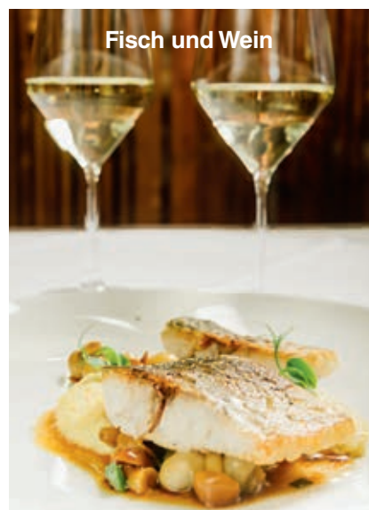
Fisch und Wein