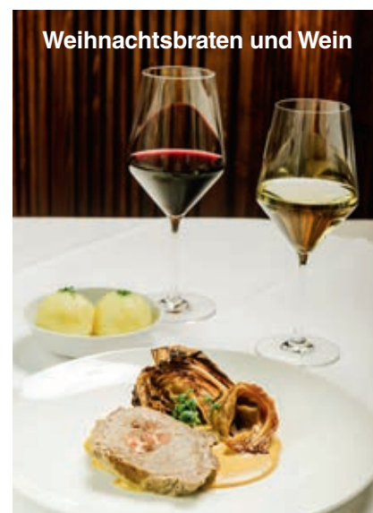
Weihnachtsbraten und Wein